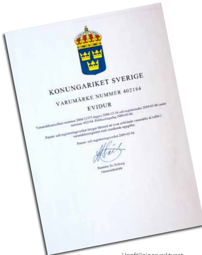
Uppföljningsverktyget fick namnet EVIDUR® som nu är skyddat.

Redan nu kan vi dra vissa slutsatser eftersom vi har drygt 160 utskrivningsskattningar. EVIDUR® har mottagits väl